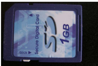
Een 1 GB SD-kaart (in het toestel)