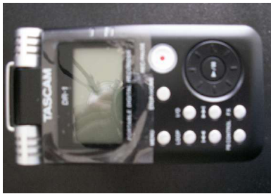
Het Tascam opnametoestel