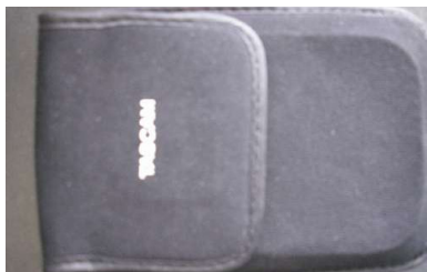
De hoes van het toestel